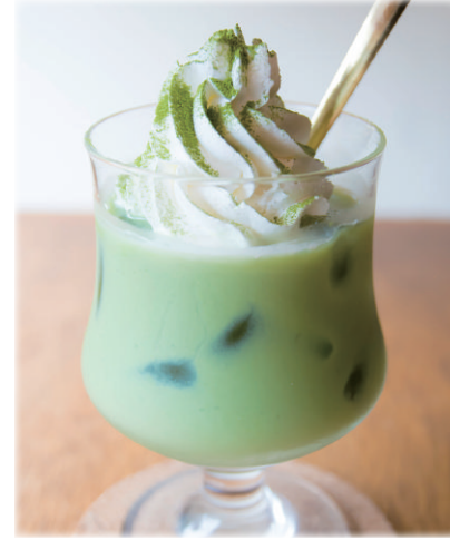
ホット抹茶ミルク / ¥ 600 アイス抹茶ミルク

Green tea milk with whipped cream(hot/ice)