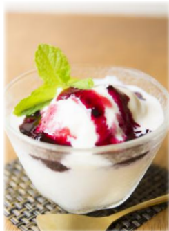
ミニアイス ¥ 330 ヨーグルト Mini vanilla and yogurt