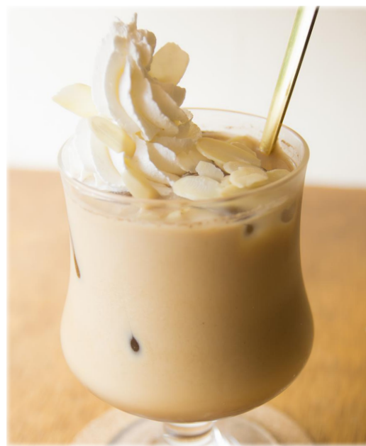
☞ アーモンドオーレ/ ☞ アイスアーモンドオーレ ¥ 650 Almond coffee / ice almond coffee カフェオレに甘いアーモンドフレーバーを加え アーモンドチップを添えた一杯