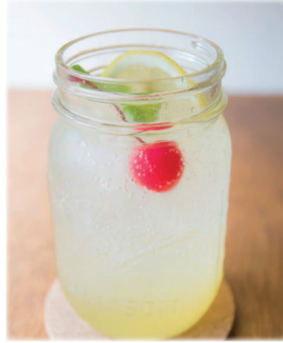
レモンスカッシュ ¥ 650 Fizzy lemonade