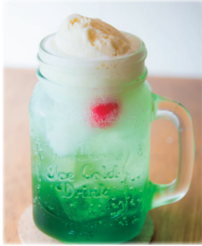
クリームソーダ ¥ 650 Ice cream soda