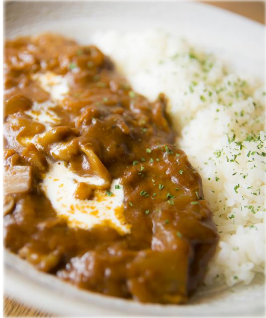
カレーライス ¥ 600 Curry and rice