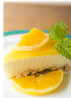
オレンジの ¥ 450 レアチーズケーキ Orange no-bake cheesecake