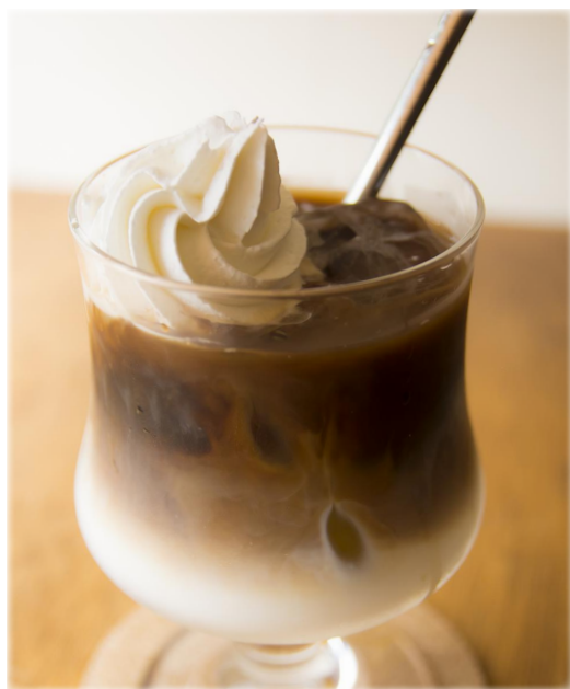
☞ カフェオレ/ ☞ アイスカフェオレ ¥ 550 Cafe au lait / Ice cafe au lait ミルクに濃い目のコーヒーを合わせた 定番のアレンジコーヒー